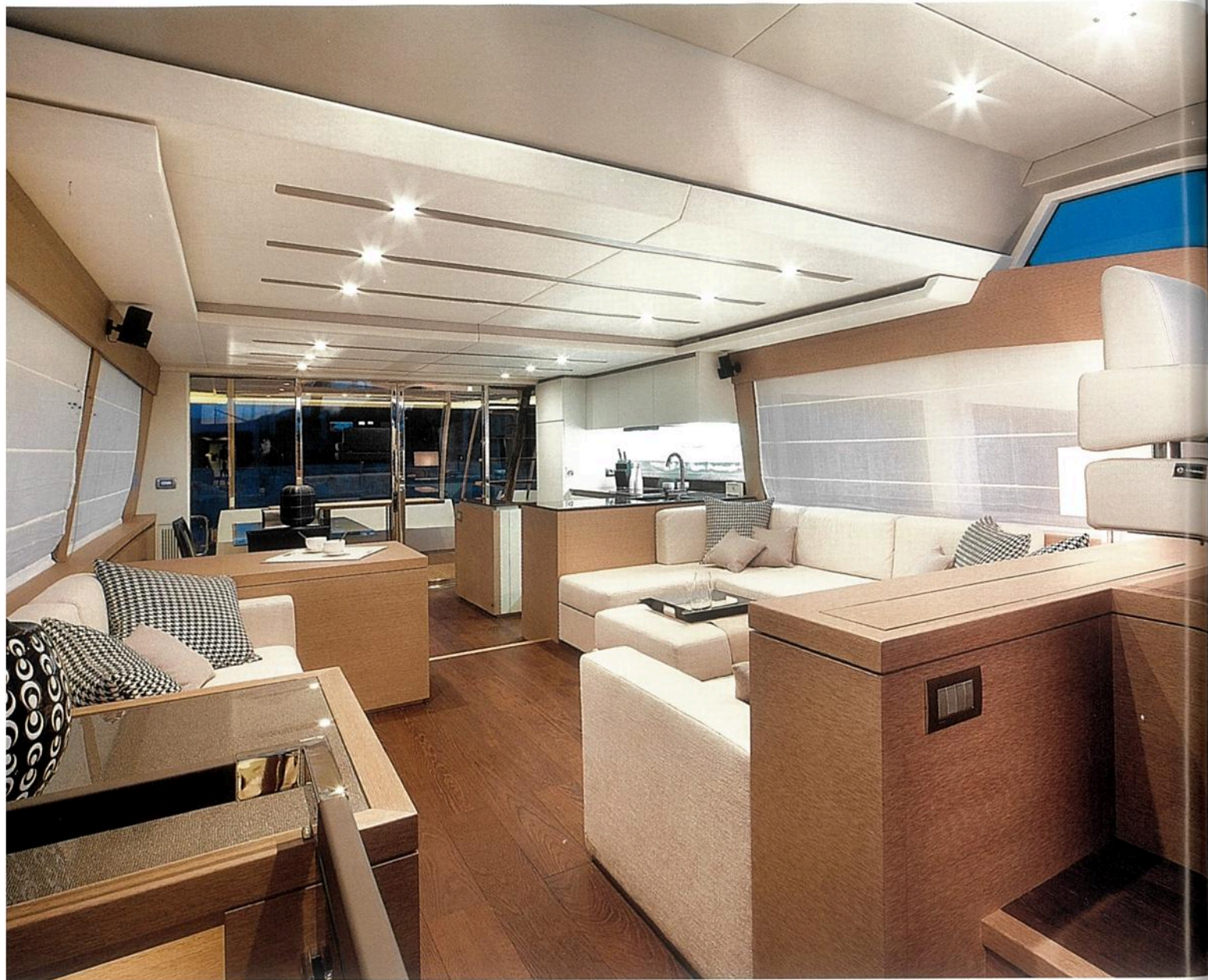
L'intérieur décloisonné présente des modules bien définis avec le poste de pilotage, le salon et la cuisine sur l'arrière.

L'ÉTENDARD de la marque enfonce un coin dans le monde de la plaisance haut de gamme, à mi-chemin entre les grandes vedettes à fly et les mini-yachts. Les Prestige 550 et 620 avaient ouvert la voie vers des unités de taille importante, et, comme les huit autres modèles de la gamme, elles s'accommodent d'une fabrication en série normalisée. Avec la Prestige 750, tous les codes connus changent. C'est pourquoi la marque s'est tournée vers l'usine des grands yachts du groupe Bénéteau située à Montfalcone, au nord-est de l'Italie, qui produit déjà les Monte Carlo Yachts. Les concepteurs historiques des Prestige, Jean-François de Prémoré et le cabinet d'architectes italiens Garroni Design, ont jeté les bases de la 750 il y a trois ans, en partant d'une idée originale : placer la cabine du propriétaire à l'avant, en opposition avec la tendance actuelle des grandes cabines centrales traversantes. « Nous avons dessiné le bateau autour de la cabine avant, et cette cabine a induit tout le reste », explique J.-F. de Prémoré. Une idée qui semble dans l'air du temps, puisque Ferretti, avec la 920, et Azimut avec la Grande 95 RPH l'ont également adoptée. « Nous avons également voulu conserver l'ADN des Prestige, à savoir des bateaux simples