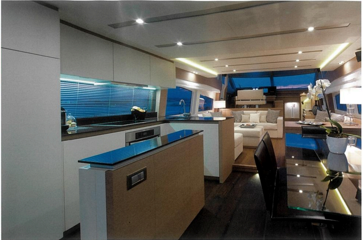
La cuisine et la salle à manger sont placées à l'arrière, comme un sas isolant le salon de l'extérieur. Une disposition qui facilite le travail du cuisinier, qui offre une position aérée aux convives et qui met la cuisine en contact avec l'extérieur.