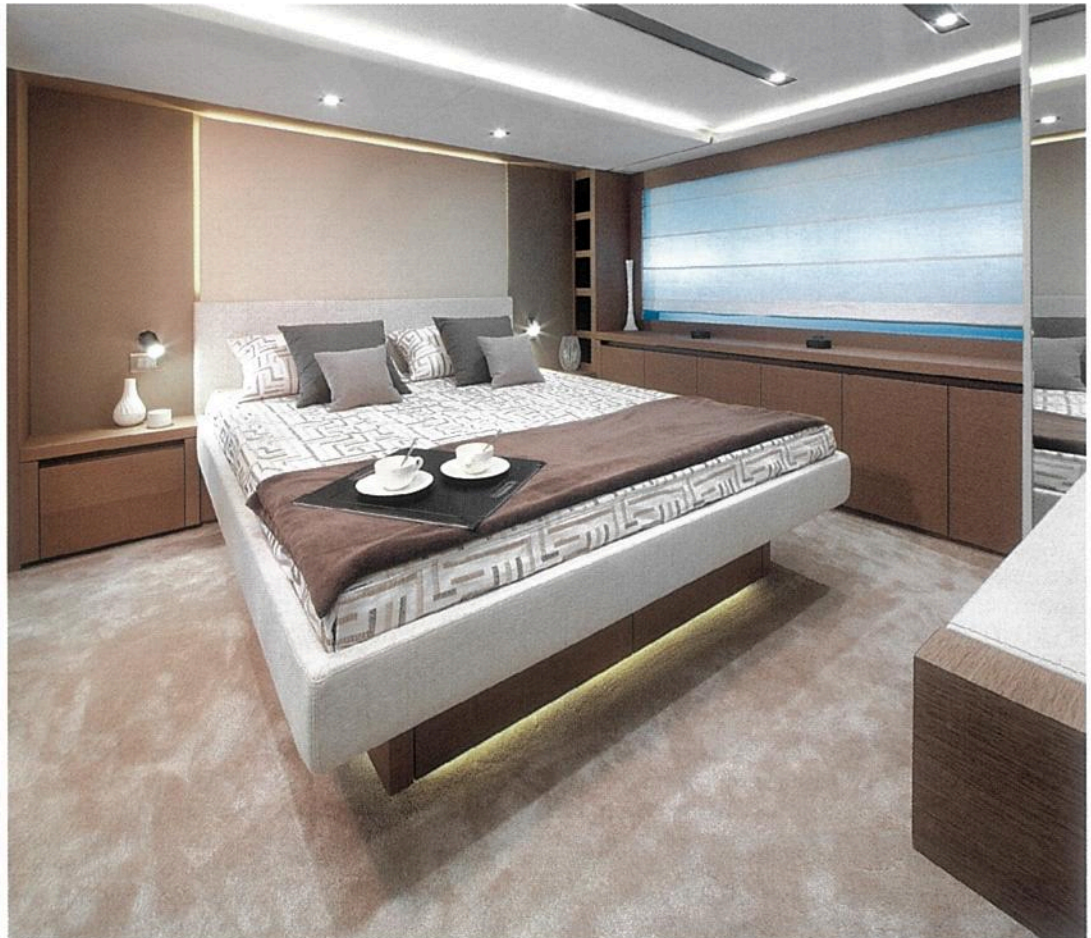
La cabine VIP a pris la place habituelle de la master cabin au centre du bateau. Elle est traversante avec un bel éclairage de bordé. La salle de bains en longueur occupe le flanc tribord.

LE CHOIX AUDACIEUX DE LA CABINE AVANT RELÈVE D'UNE LOGIQUE IMPARABLE.