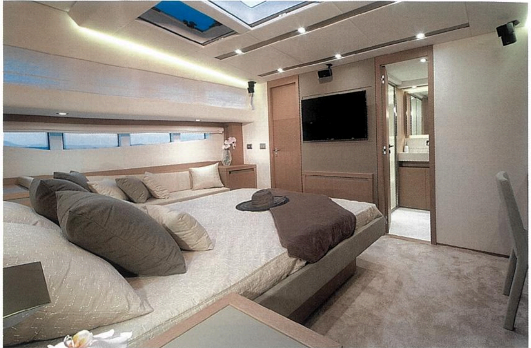
Située à l'avant et surélevée, la cabine principale bénéficie d'un éclairage naturel latéral et zénithal. Sa position avancée facilite son accès depuis le salon, isole du bruit, et procure une vraie intimité.