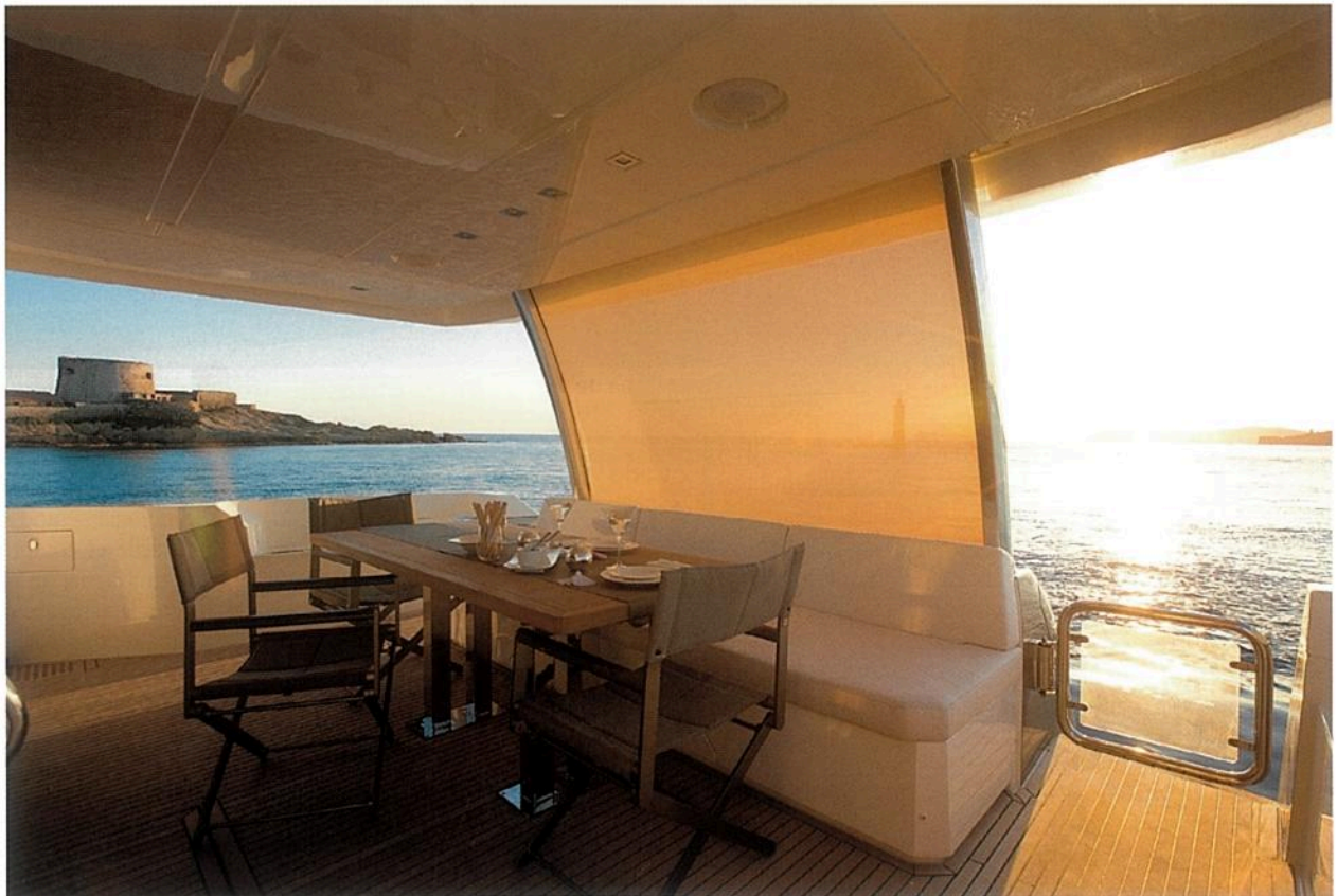
Le cockpit est protégé par la longue casquette du fly ; le rideau pare-soleil permet aussi une certaine intimité au mouillage comme au port. Six convives prennent place autour de la table en teck et inox.

LA PRESTIGE 750 CONSERVE SON ADN, AVEC UNE TOUCHE DE GLAMOUR ITALIEN.