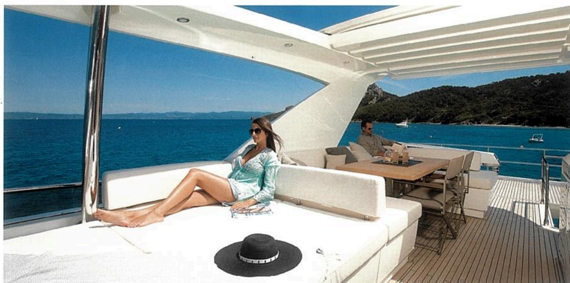
Le fly est protégé par un hard-top rigide agrémenté d'un toit souple rétractable. Les aménagements offrent beaucoup de confort et d'espace en privilégiant une circulation libre. On y trouve une cuisine complète.

► du carré. Toujours depuis le palier, un escalier en colimaçon conduit aux autres cabines, dont la VIP traversante qui a peu à envier à celle du propriétaire, puisqu'elle dispose également d'un beau dressing et d'une salle de bains avec douche indépendante.