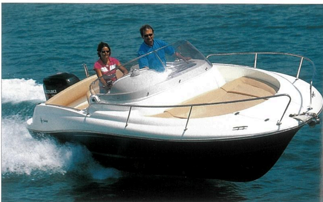
Très agréable à piloter, la version walkaround du CC 715 se caractérise par un bain de soleil sur l'avant.