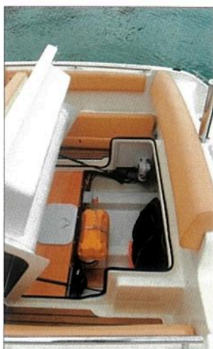
La banquette adossée au tableau arrière bascule vers l'avant et dévoile une grande soute qui reçoit, entre autres, la batterie et le coupe-batterie.