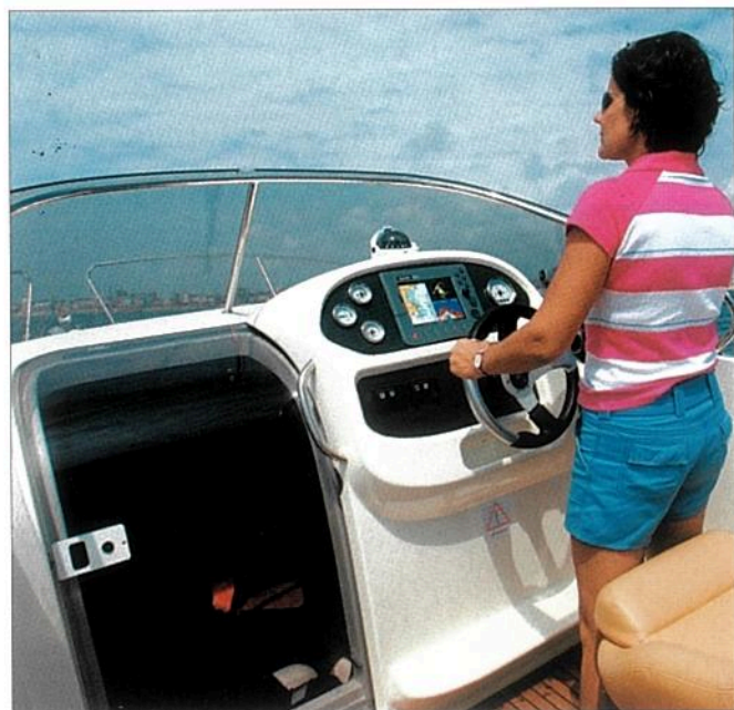
Le poste de pilotage est abrité derrière un pare-brise gris, lui-même bordé par une main courante. Notez aussi le repose-pieds intégré.