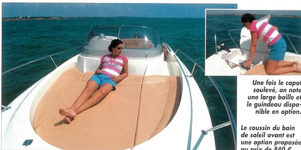
Une fois le capot soulevé, on note une large baille et le guindeau disponible en option.