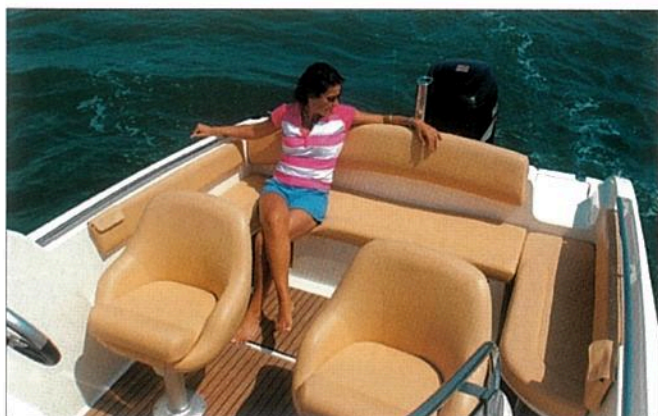
En version Luxe, les banquettes latérales rabattables, installées de part et d'autre de la banquette centrale, sont pourvues de dossiers.