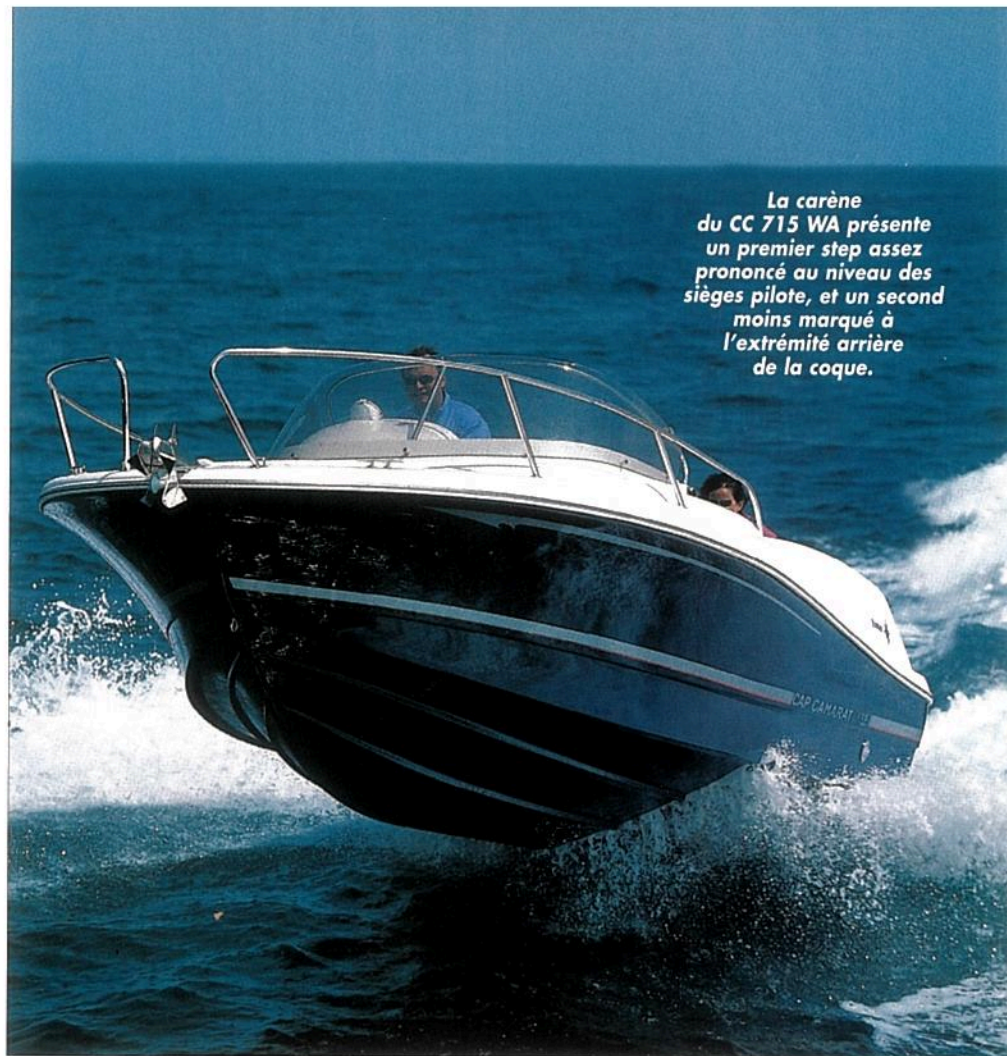
La carène du CC 715 WA présente un premier step assez prononcé au niveau des sièges pilote, et un second moins marqué à l'extrémité arrière de la coque.